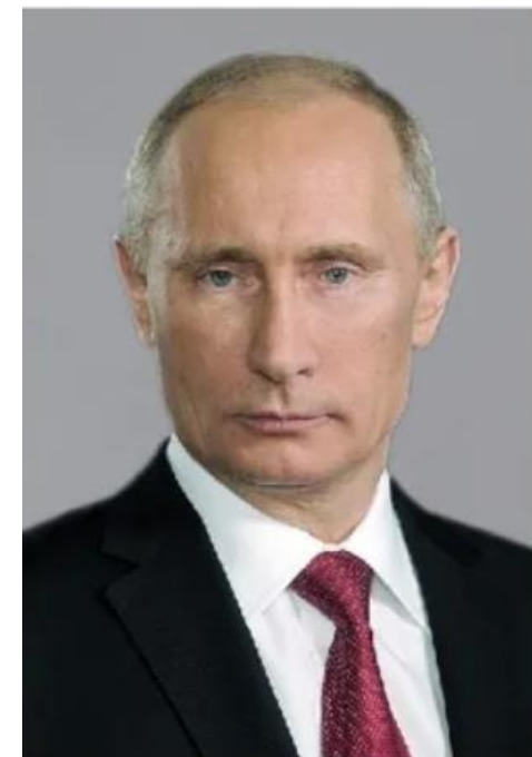
Путин В. В.

«Через воспитание молодежи сохраняется связь поколений, историческое единство нашей страны. Тем самым, формируя прочную основу не только нашей безопасности, технологической, экономической независимости и самодостаточности, но и духовного, ценностного суверенитета».