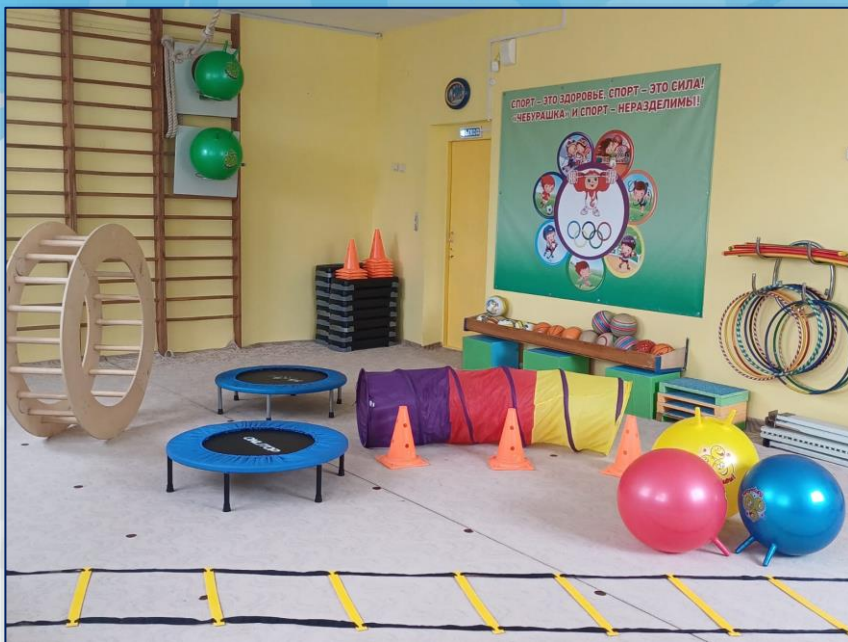
детский сад «Чебурашка»