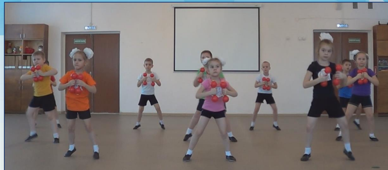
РИТМИЧЕСКАЯ ГИМНАСТИКА С ПЛАСТМАССОВЫМИ ГАНТЕЛЯМИ