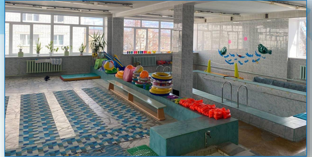
детский сад «Алёнушка»