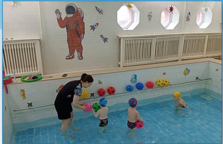
детский сад «Ёлочка»