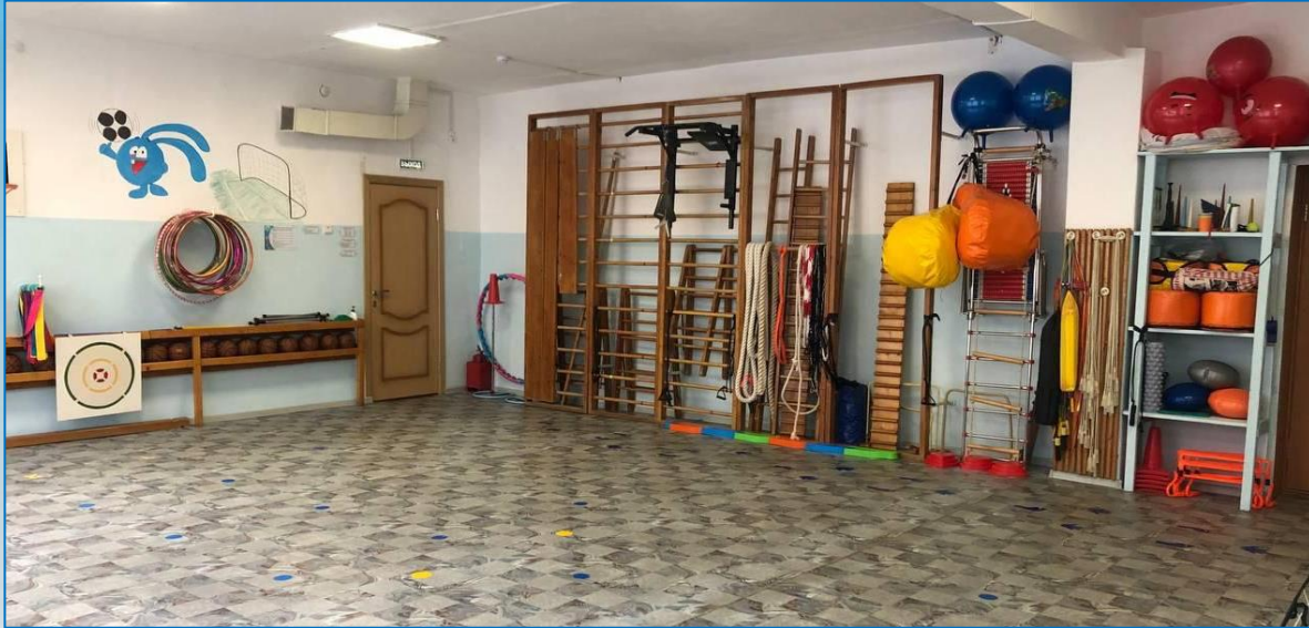
детский сад «Гнёздышко»