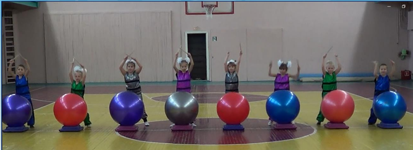
ФИТНЕС С БАРАБАННЫМИ ПАЛОЧКАМИ И С МЯЧАМИ АЛИФА (ФИТБОЛЫ)