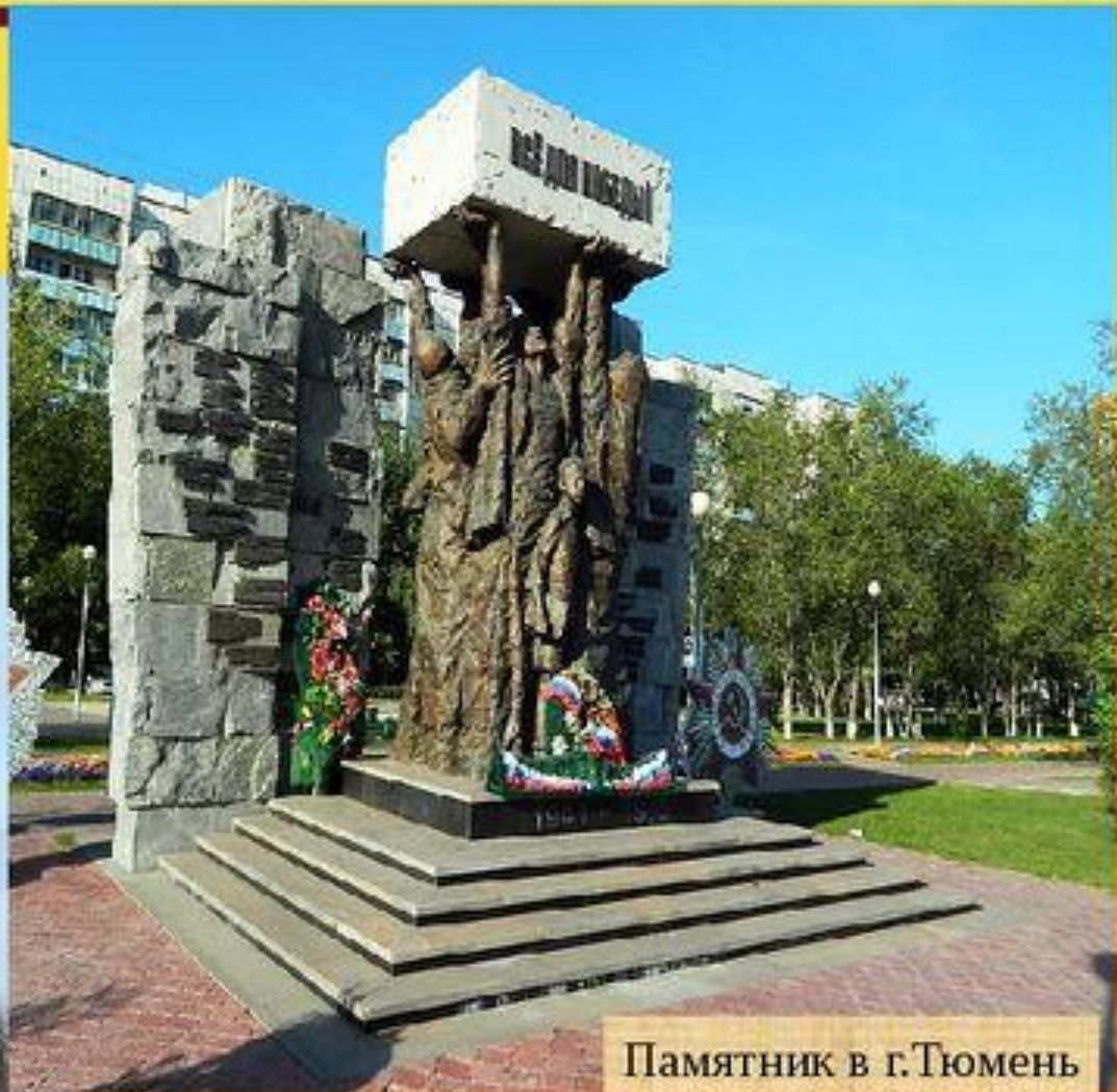
Памятник в г.Тюмень