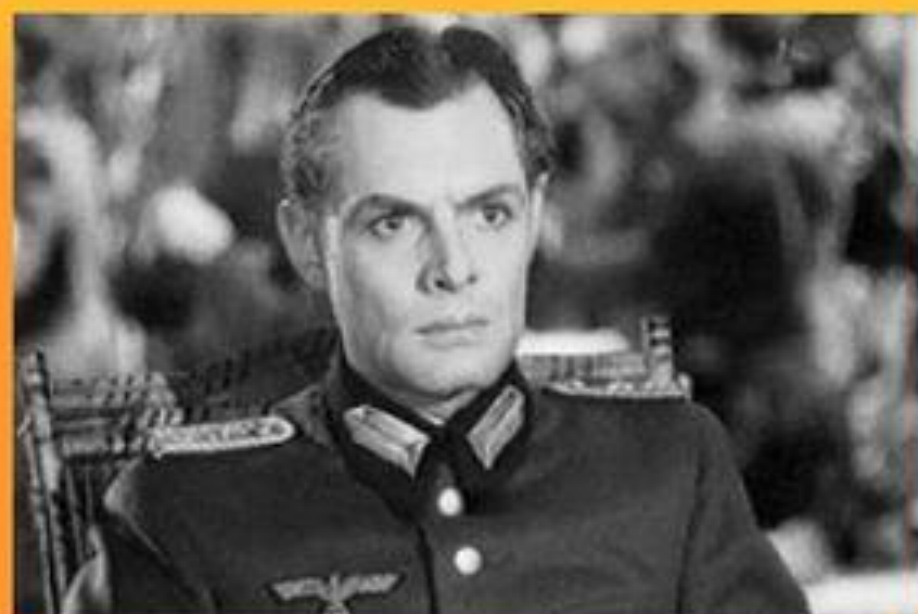
П. П. Кадочников