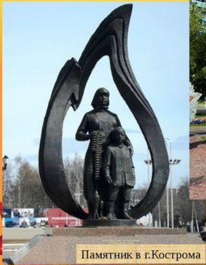
Памятник в г.Кострома