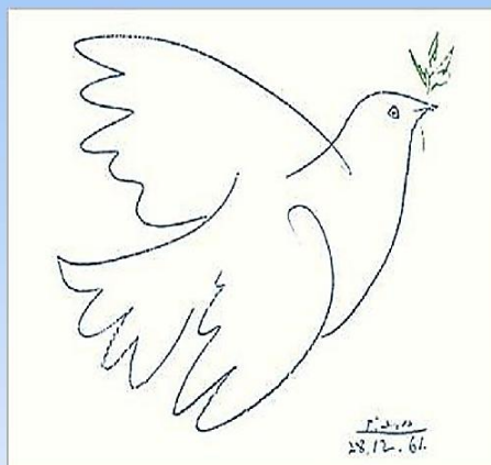
Рисунок 1961 года